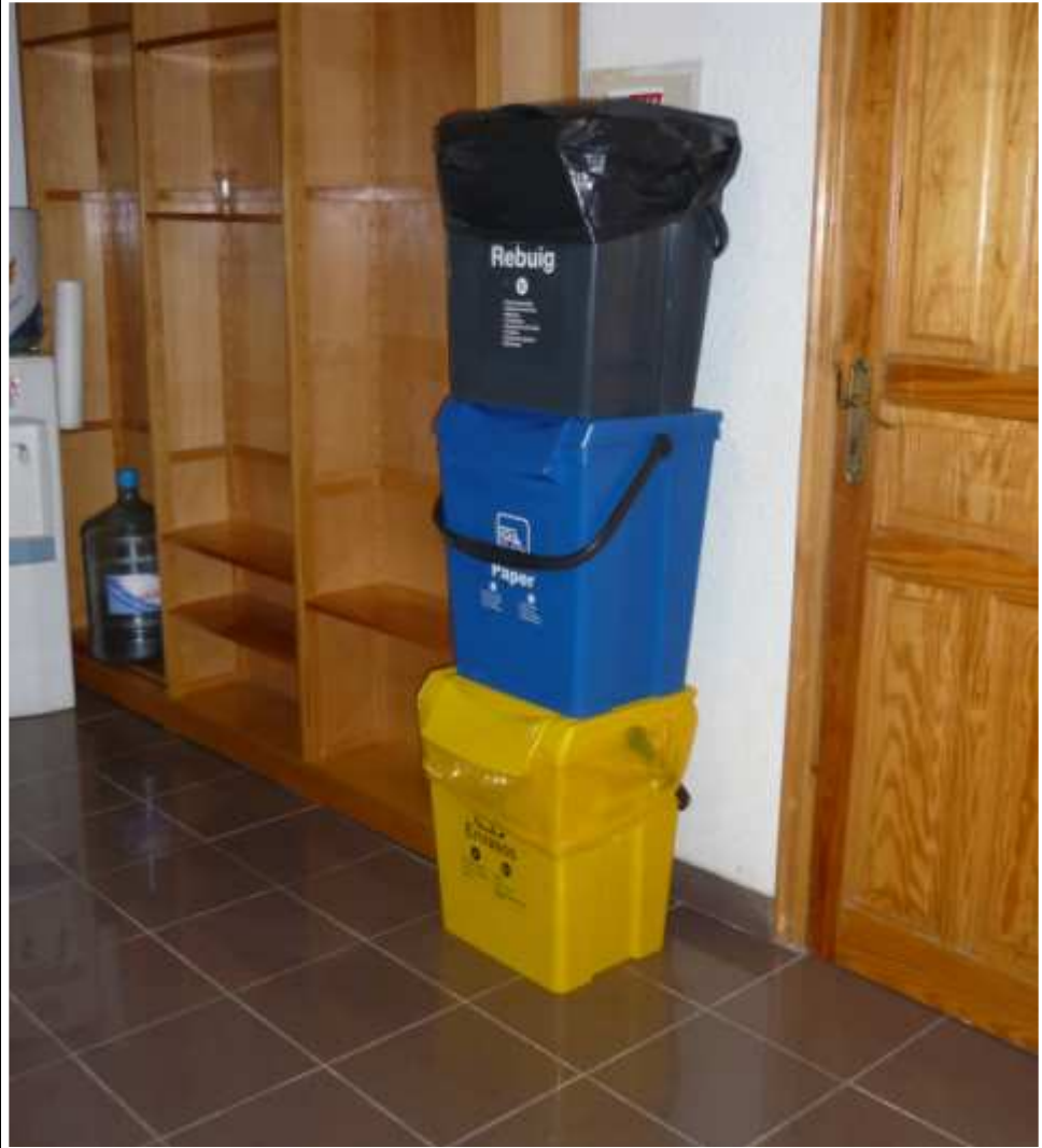
Fotografia de l'experiència (3)